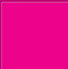
Figura 2 C=0 M=100 Y=0 K=0 R=236 G=0 B=140 HEX: #EC008C

Figura 1. Os tipos de letra. O corte Gerusa Obese Italic é exclusivo do FEST.