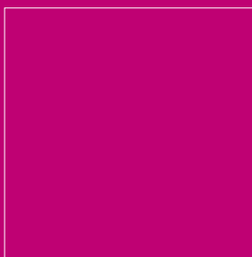
Figura 3 C=0 M=100 Y=0 K=22 R=192 G=0 B=114 HEX: #C00072